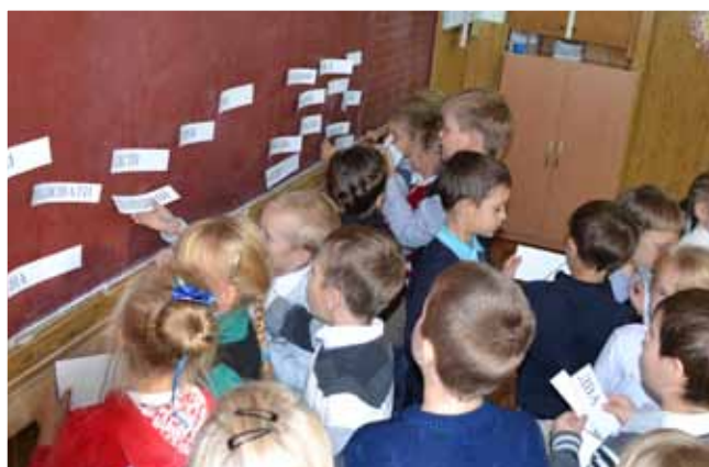
Цікава дуже, хоч іще для нас незвична, Робота з текстом колективна лінгвістична

— Про яку місцевість у статті не згадувалося?