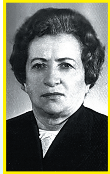
обчислювали параметри боєголовок.

Те, що колись в Союзі називалось лженаукою тепер допомагає вирішувати численні проблеми. Завдяки адресній мові програмування комп'ютери почали вести розрахунки траєкторій польоту балістичних ракет, ядерної зброї,