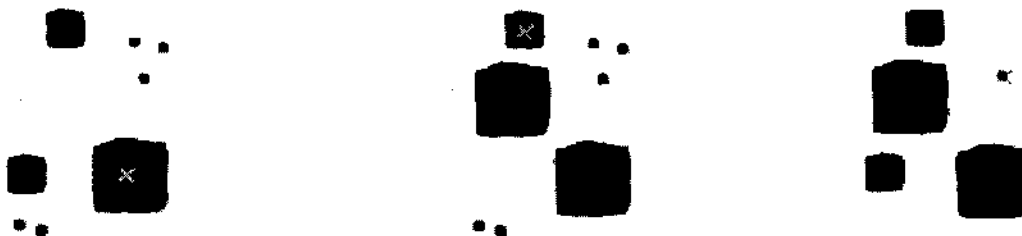
Рис 3 а. Виділення плями в якості композиційного центру за ознакою розміру.

Композиційний центр це спеціально виділене місце в композиції, яке має якості, властиві тільки йому. Композиційний центр не є геометричним центром листа або картинного поля. У своїх розробках Є. Стасенко пропонує способи виділення композиційного центру: