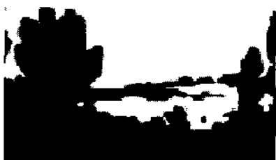
Рис 1. Тональна чорно-біла композиційна схема. Так для врівноваження композиційної будови Є. Стасенко пропонує враховувати умови комфортності сприймання структури твору.

У ХХ ст. аналіз структурних відносин і зв'язків займає чільне місце в дослідженнях мови, етнічних спільнот, творів літератури та мистецтва, культури в цілому, в результаті чого складаються специфічні прийоми і методи вивчення різних типів структури [1]. Таким чином трактування поняття структури у стосунку до композиції як способу визначення форми твору дозволяє виявити зміст ідеї автора.