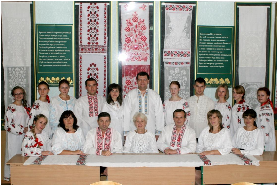
Фото 8. Студенти та викладачі факультету технологій та дизайну у музеї декоративно-прикладної творчості факультету