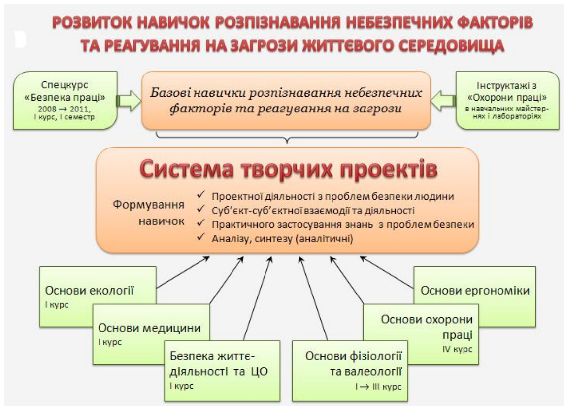
Рис. 2. Система проектів в структурі безпеко-орієнтованої підготовки

Серед прийомів, які нами використані під час розробки тренінгів слід назвати: а) конструювання проблемних ситуативних завдань; б) творча дискусія (толерантне, вільне від оцінок обговорення різних поглядів на поставлену проблему і розв'язання наукових або прикладних завдань); в) творчі рольові ігри, прямим наслідком яких є створення проекту розв'язання обраної групою проблеми, його презентація та захист; г) прийоми формування навичок самостійного визначення проблеми для дослідження, інформаційного пошуку, пошуку партнерів, експертів та ін. Загальні вправи, використані нами під час реалізації тренінгу: презентація, короткі вправи на початку занять, мозковий штурм, дискусія у групі, обговорення у групі, робота в малих групах, "заверши послідовність дій", аналіз ситуативних задач, навчальне відвідування, "Промова", вправи для підведення підсумків та ін.