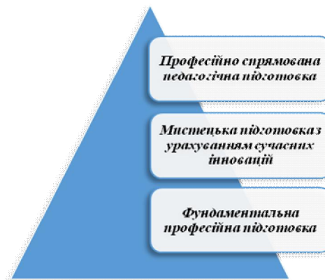
Рис. 2. Підготовка майбутніх дизайнерів у вищих навчальних закладах до викладацької діяльності

Успішність підготовки майбутнього фахівця з дизайну визначається сукупністю передумов щодо підготовки майбутніх дизайнерів у вищих навчальних закладах до викладацької діяльності (рис. 2).