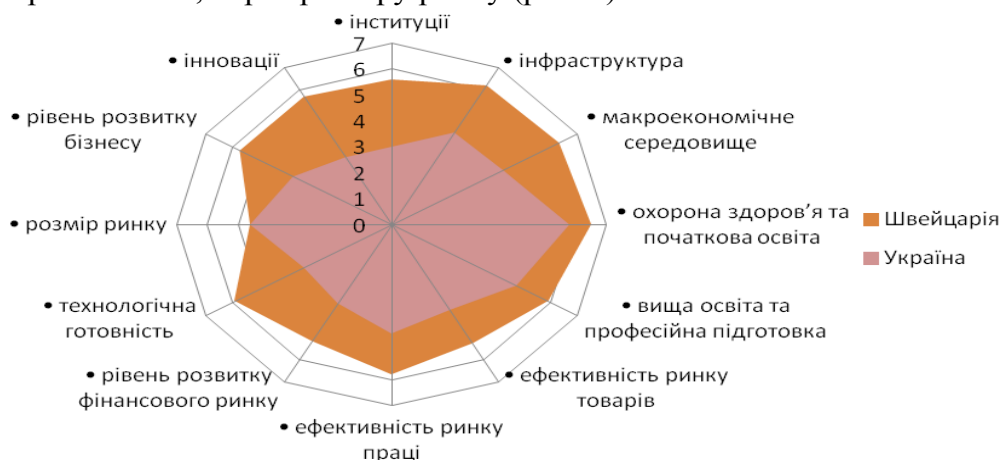
Рис. 1. Порівняння профілів конкурентоспроможності Швейцарії та України за ІГК 2013 – 2014 рр.

За результатами звіту з конкурентоспроможності 2013–2014 рр. першу позицію посіла Швейцарія, в десятку лідерів також входять Сінгапур, Фінляндія, Німеччина, США, Швеція, Гонконг, Нідерланди, Японія, Великобританія. Як свідчать представлені дані, Україна поступається Швейцарії за всіма складовими конкурентоспроможності, окрім розміру ринку (рис. 1).