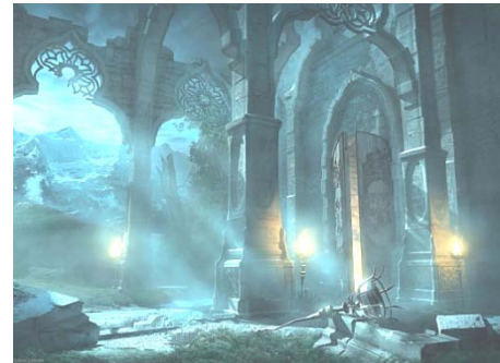
Рис. 4. Картина Ф. Страуба “Парк”

П.: 91. Значить, ви цінуєте свободу. Згідно архетипної символіки, з'єднання з землею означає єднання з матір'ю, з батьками в цілому. Чи так це у вас?