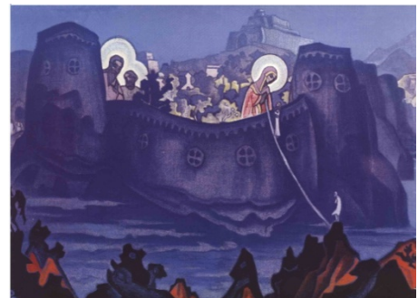
Рис. 1. Картина М. Періха "Мадонна Лаборис"

І.: 22. Такий стан з'являється, коли я перебуваю в ситуації фігурки в "пеклі" (рис. 1). 22а. Коли почуття, душа відлітають, щоб бачити перспективи, то шарф – це те, за що можна триматися.