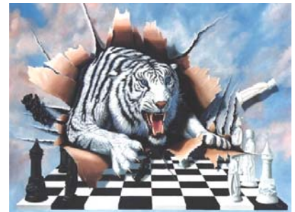
Рис. 3. Картина Д. Тодда "Втрачаючи"

І.: 60. Він не підозрює про існування порожнечі, він не знає, що може бути така реакція (вказує на птаха, який відлітає, рис. 2), але знає, що може бути реакція на прояв агресії (рис. 3).