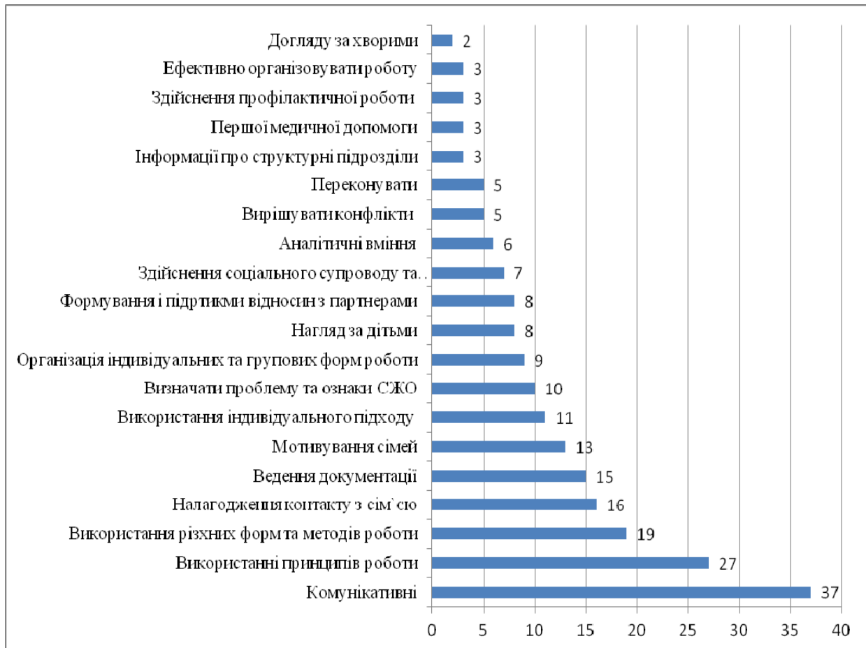
Рис 2. Результати відповіді експертів на запитання: «Які практичні вміння необхідні спеціалісту для успішної роботи з сім'ями, які опинилися у складних життєвих обставинах? (Напишіть основні)».

Таким чином, нами було здійснено оцінку рівня теоретичної та практичної підготовки спеціалістів до роботи з сім'ями, а також було визначено основні знання та навички, необхідні для ефективною реалізації такої діяльності. Отже, визначено знання , необхідні для успішної роботи з сім'ями, які опинилися у складних життєвих обставинах, зокрема щодо нормативно-правової бази, яка регулює таку діяльність; форм та методів роботи з сім'ями, які опинилися у складних життєвих обставинах; особливостей роботи з сім'ями, які опинилися у складних життєвих обставинах; ведення документації. Серед необхідних практичних вміннь , які необхідні спеціалістам для ефективною роботи з сім'ями визначено: комунікативні вміння; впровадження принципів соціально-педагогічної роботи; використання різних форм та методів соціально-педагогічної роботи з сім'ями; налагодження контактів з сім'єю; ведення документації; мотивування сімей до співпраці; реалізація індивідуального підходу у роботі; діагностика ознак складних життєвих обставин та проблеми сімей; організація індивідуальних та групових форм роботи з дітьми та сім'ями; формування і підтримка взаємодії з партнерами та нагляд за дітьми.