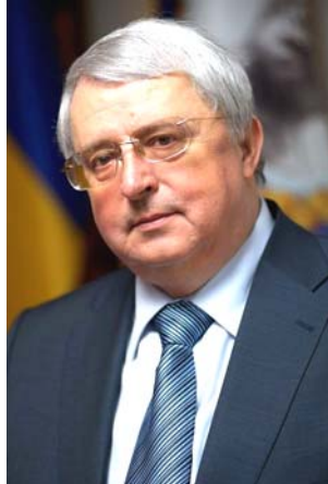
Ректор НПУ імені М. П. Драгоманова Академік НАПН України, академік НАН України В. П. Андрущенко

Філософія в єдності з психологією визначає цілісність психічного (свідоме-несвідоме) як засадничий принцип глибинного пізнання. Без чітко окресленої методології, яка асимілює відповідну теорію, світовідчуття та світогляд вченого – психологічні дослідження не можуть бути відповідними сучасним вимогам. Зокрема, психологія зобов'язана асимілювати результати досліджень в інших, близьких галузях науки. На таку увагу заслуговує фізіологія, зокрема, дослідження П. К. Анохіна в його відкритті рефлекторного кільця, що включає «апцептор дії», який акумулює емотивно регулюючі важелі впливу на поведінку в контексті прогнозування результатів дії (активності). Констатація невідповідності не лише спричиняє виникнення негативної емоції, а й спонукає до повторюваності дій, їх довершеності. В перспективі важливо співвіднести таку «вимушену повторюваність» з відкриттям З. Фрейдом закону «вимушеного повторення», як і з введенням ним категорії « віруючого очікування ». Зазначені ефекти