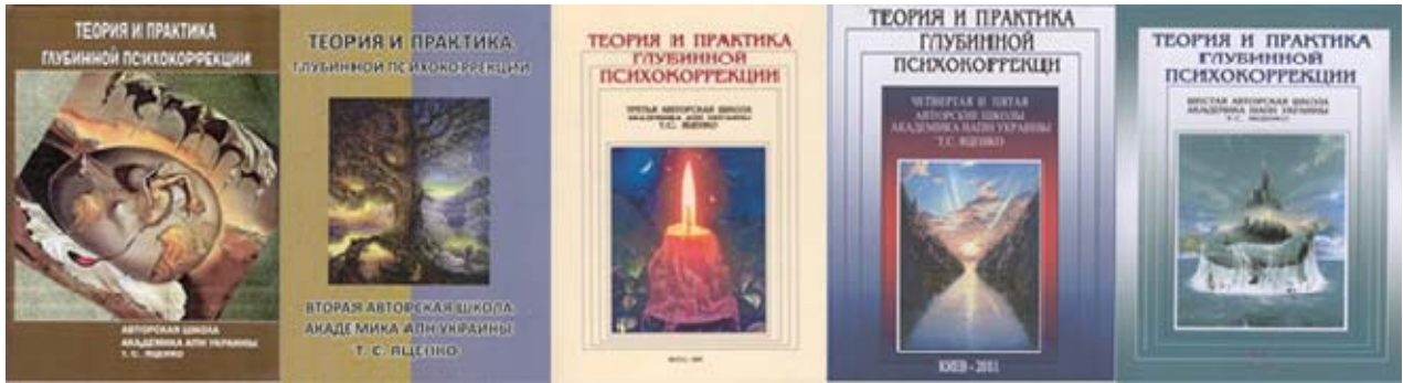
Фото 1. Книги за Авторськими школами

Більш як 30-літній досвід Т.С. Яценко в галузі глибинної корекції призвів до необхідності його філософського осмислення й узагальнення, чому сприяє співпраця з ректором Національного педагогічного університету імені М. П. Драгоманова, доктором філософських наук, професором, академіком НАПН України В. П. Андрущенком [26; 27; 28]. Це надало нового мета-дихання психодинамічній теорії і відповідній практиці глибинної корекції. Як наслідок – створено науково-дослідну лабораторію глибинної корекції (далі – Лабораторія) при Національному педагогічному університеті імені М. П. Драгоманова (рішенням Вченої ради від 26 грудня 2011 р.), на базі Інституту педагогіки і психології (м. Київ) за активної участі його директора, академіка НАПН України В. І. Бондаря. Центр (спільно з Лабораторією) двічі на рік проводить: наукові сесії для дослідників, аспірантів і докторантів із різних проблем глибинно-психологічного пізнання цілісної психіки; Всеукраїнський семінар із проблем глибинного пізнання (з щорічною конкретизацією тематики), що відображають відповідні збірники статей, видані при НПУ імені М. П. Драгоманова [21 – 27].