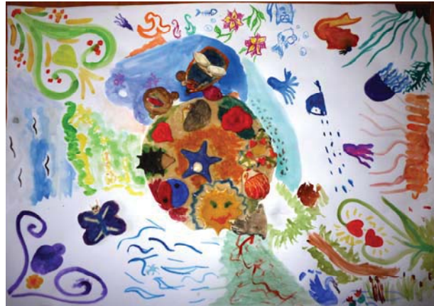
Фото 17. Групові колажі з використанням ліпки

Висновки. Авторські школи академіка НАПН України Т. С. Яценко є однією з основних форм підвищення кваліфікації психологів-практиків. Така форма роботи сприяє розумінню фахівцями-психологами сутності психодинамічної теорії і відповідної методології. Проведення Авторських шкіл академіка НАПН України Т. С. Яценко з глибинної психокорекції в синтезі психодинамічної теорії з психологічною практикою, створює базу для розвитку теоретико-методологічних основ практичної психології в Україні.