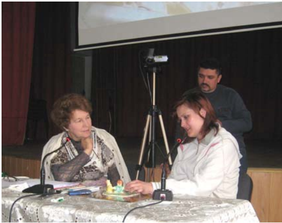
Фото 10. Психоаналітична робота академіка НАПН України Т. С. Яценко з протагоністом К. з використанням ліпки

На VII Авторській школі Т. С. Яценко презентувала теоретичні та методологічні засади глибинно-психологічного пізнання в поєднанні з процесом безпосередньо глибинної практики. Екранізація процесу глибинного пізнання у великій групі учасників передбачала використання методів, що спираються на метафоричність пізнання, що сприяло відчуттю захищеності протагоніста та учасників глибинного процесу. Разом з тим метафорично-матеріалізовані форми, які пов'язані з використанням предметних засобів глибинного пізнання потребують психоаналітичного діалогу, центрованого на цілісному пізнанні психіки конкретної особи. На VII Школі використовувалась робота з тістом в його архетипному змісті з метою візуальної самопрезентації суб'єкта (фото 10) [6].