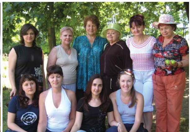
Фото 7. Виїзд на природу

IV Авторська школа засвідчила завершеність психодинамічної теорії та практики, усистематизованість методів, які мають особливий потенціал в їх поєднанні та синтезі. Робота Т. С. Яценко актуалізувала в учасників Школи інтелектуальне осмислення теорії та практики глибинно-