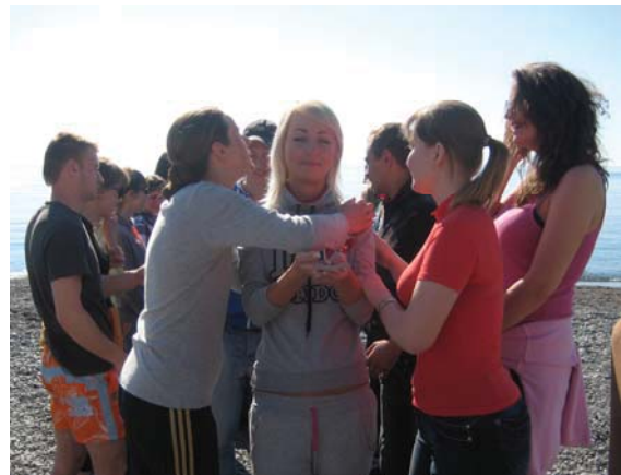
Фото 4. Вправа «Перетягування» Фото 5. Вправа «Коридор кохання»

Охарактеризуємо кожен Авторську школу в її науково-практичній спрямованості. Під час I Авторської школи вперше у великій аудиторії об'єктивовано можливості психоаналізу із застосуванням різних методичних прийомів у роботі практичного психолога. На заняттях були презентовані теоретичні та методологічні засади глибинно-психологічного пізнання в поєднанні з процесом безпосередньо глибинної