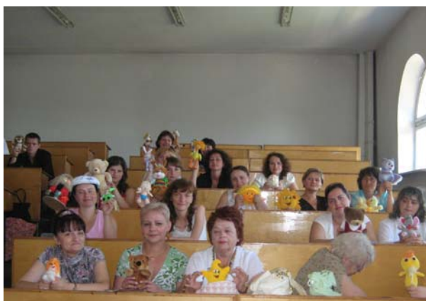
Фото 6. Робота з іграшкою

На III Авторській школі Т.С.Яценко акцентувала увагу на методологічних аспектах взаємозв'язків свідомого і несвідомого в психіці та їх впливові на адаптацію суб'єкта до соціуму, що передбачало розкриття функціонально-структурних особливостей цілісного феномену психіці на матеріалі розробленої Т. С. Яценко «Моделі внутрішньої динаміки психіки». В рамках проведення школи проводилася фронтальна робота з використанням іграшок, що передбачало діагностико-корекційну роботу в парах (фото 6). Особливою подією III Авторської школи став виїзд на природу (агротехнічна станція Уманського держаного педагогічного університету імені Павла Тичини), де були створені сприятливі умови для відпочинку і проведення підсумків роботи: польова каша, ігри і пісні (фото 7) [3].