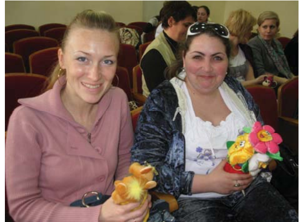
Фото 12-13. Психоаналітична робота учасників Школи з використанням іграшок у парях психолог-протагоніст

VIII Авторська школа стала віхою у фундуванні об'єктивності глибинного пізнання, яке йде за природою психічного, іманентно заданим порядком. У процесі психоаналітичної роботи відбувалося наближення до об'єктивності законів психіки, які визначають суб'єктивізм, який обумовлює ітеративність, ригідність її поведінки тощо. Проходження Школи сприяло розумінню її учасниками об'єктивної детермінованості суб'єктивізму психічного законами функціонування несвідомого, пізнання яких дає індивіду можливість вибору й реалізації власного потенціалу. VIII Школа випустила презентувала цінність матеріалізації, що сприяє символізації перекодування латентних смислів несвідомого у візуалізовані презентанти. Цілісність самопрезентації, що виявляється в роботі з каменями, ліпкою, комплексом авторських тематичних малюнків, сприяла образній візуалізації індивідуалізованої сутності психічного.