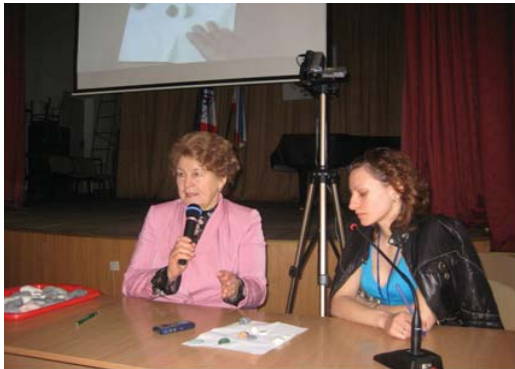
Фото 8. Психоаналітична робота з використанням каменів з протагоністом О.

психологічної корекції. Цьому сприяли процеси співпереживання, співпричетності до цілісного глибинно-психологічного пізнання, інтелектуальної співтворчості, ідентифікації та ін., що створювало відчуття єдності та спільної спрямованості, на особистісно-професійне зростання. У актовій залі де проходили лекції Т.С.Яценко, була зосереджена увага на методологічних засадах глибинно-психологічного пізнання та об'єктивуванні закономірностей розвитку психіки. Глибинно-корекційний процес, що був також презентований у актовій залі, передбачав використання таких методів, які б спиралися на матеріалізовані засоби, доступні екранізації на велику аудиторію – це: неавторські та авторські малюнки, просторові моделі. Вперше презентувалися фрагменти психоаналітичної роботи з каменями (фото 8) [4]. Використання каменів у психодинамічному підході спирається на метафоричність їх змісту, необхідність забезпечення опосередкованості пізнання психіки суб'єкта. Суб'єкт, користуючись каменями, набуває здатності символічно-просторово представляти значиму життєву ситуацію чи актуальні взаємовідносини.