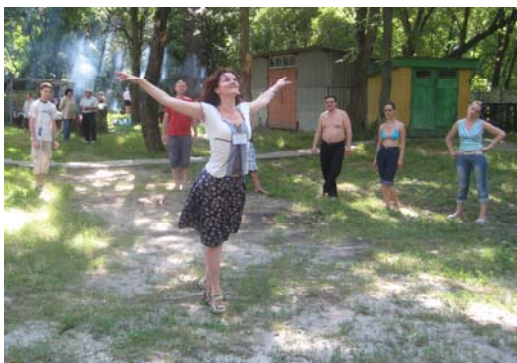
Фото 9. Невербальна вправа «Самовираження»