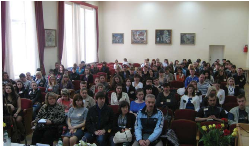
Фото 1. Учасники VIII Авторської школи, 2012 р.

школа (м. Ялта) – з 25 по 30 квітня 2011 року, VIII Авторська школа (м. Ялта) – з 22 по 28 квітня 2012 року, IX Авторська школа (м. Ялта) – з 19 по 24 квітня 2013 р.