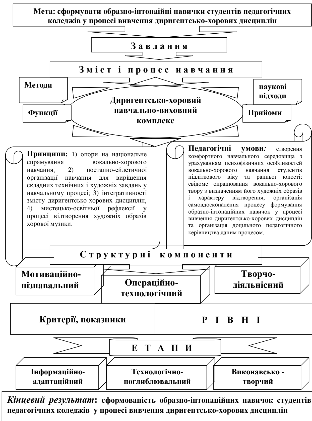
Рис. І. Організаційно-методична модель формування образно-інтонаційних навичок студентів педагогічних коледжів у процесі вивчення диригентсько-хорових дисциплін.

У третьому розділі – «Дослідно-експериментальна робота з формування образно-інтонаційних навичок студентів коледжів у процесі вивчення