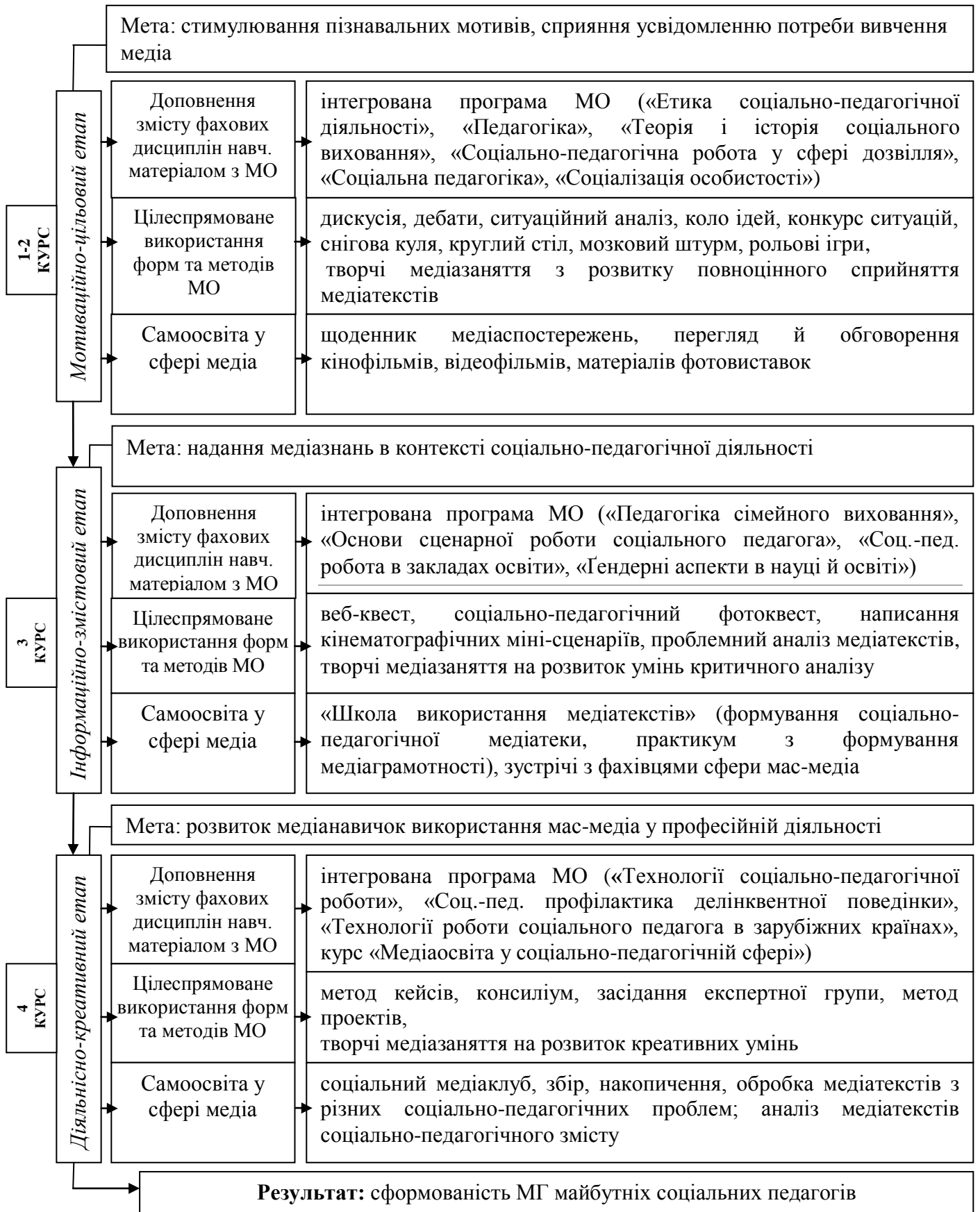
Рис.1. Алгоритм формування медіаграмотності майбутніх соціальних педагогів у процесі фахової підготовки