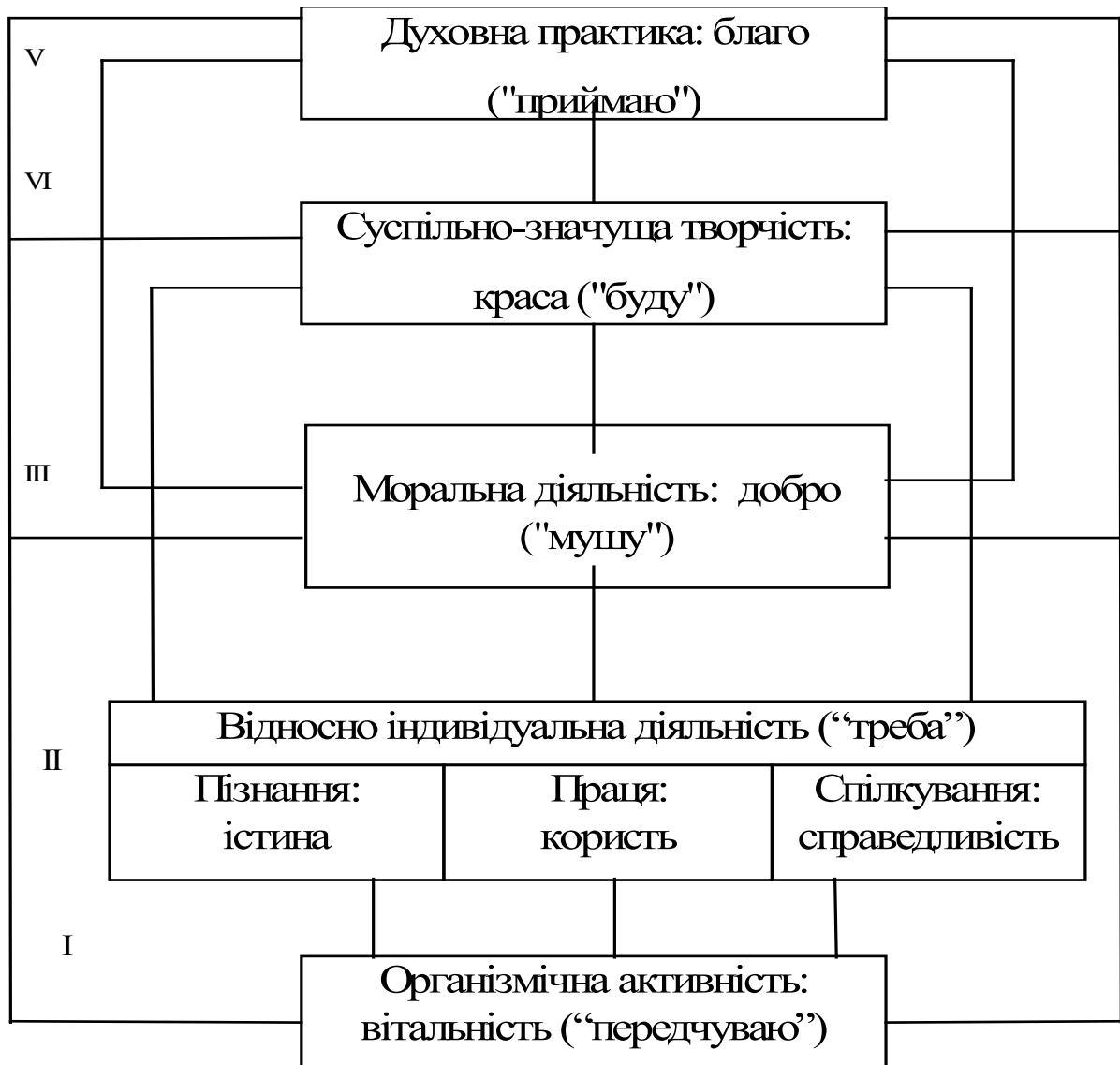
Рис. 1. Структура ціннісно-сміслової свідомості особистості.

Предметом спеціального дослідження став діалог, який розглядається в ролі універсального психологічного механізму аксіогенезу особистості. В результаті синтезу релігійно-філософської концепції М. Бубера й антропологічних ідей М. М. Бахтіна було зроблено висновок про субстанційність діалогу як форми присутності Духу.