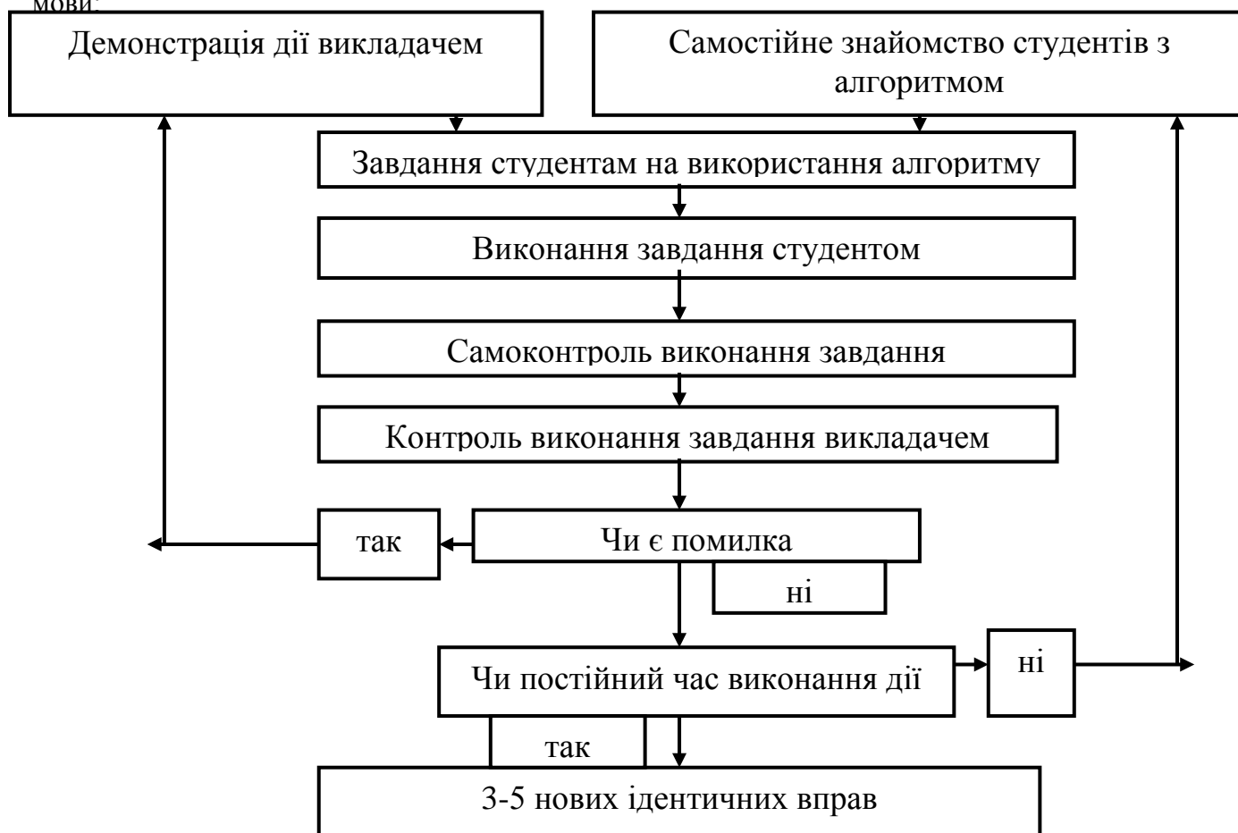
Рис. 1 Схема дії студента та викладача за мінімаксом

У другому розділі – „Експериментальна перевірка педагогічних умов розвитку пізнавальної активності студентів вищих навчальних закладів економічного профілю у процесі вивчення іноземної мови ” на основі проведеного експерименту встановлюється дидактична ефективність мінімаксного навчання іноземній мові та подається факторний аналіз якості вивчення іноземної мови: