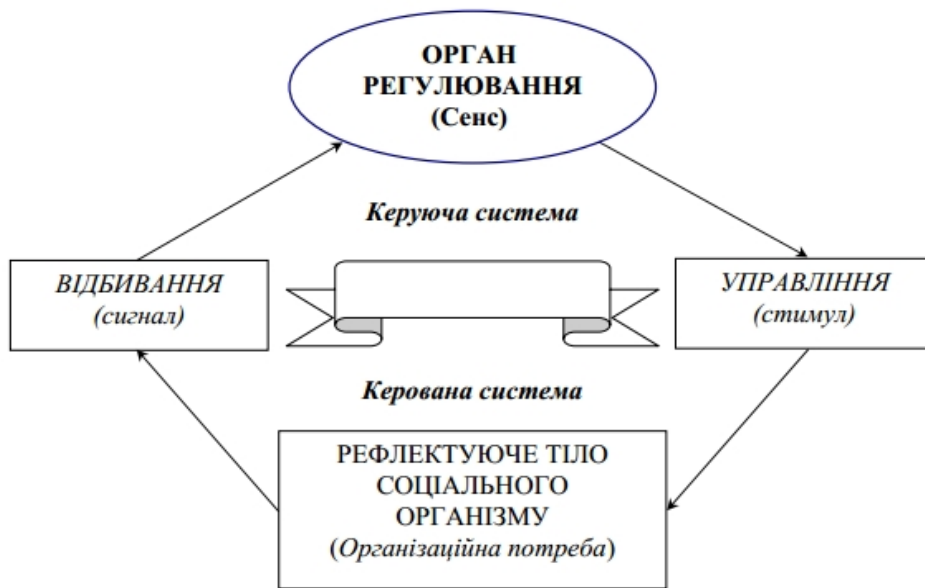
Рис. 5.3.1. Модель системи саморегулювання соціального організму країни

Ця модель саморегуляції соціального організму країни являє собою найбільш складний вид взаємодії суб'єктів або структур між собою [417, с. 254-255]. Під загальним визначенням поняття “регуляція” (регулятивний процес) ми розуміємо упорядкування соціальних процесів. При цьому під упорядкуванням процесу мається на увазі збільшення нерівнозначності ймовірностей можливих змін параметрів штучно створеної людиною реальності, тобто такий вторинний процес, який, використовуючи поняття ентропії, найчастіше характеризують як антиентропійний, або як процес зменшення ентропії [Див.: 24, с. 207-208].