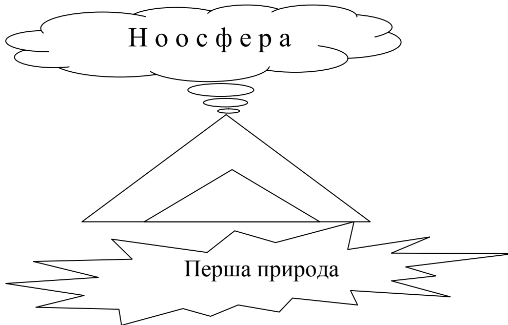
Рис. 5.3.2. Модель системи саморегулювання соціального організму країни у вертикальному вимірі

Саме за таких умов у нас з'являється можливість вписати у неї систему місцевого самоуправління регіонами, територіальними громадами та іншими соціальними спільнотами. Крім того, можна відтворити канали інформаційної комунікації, по яких залучається смислове поле ноосфери у саморегуляцію соціального цілого.