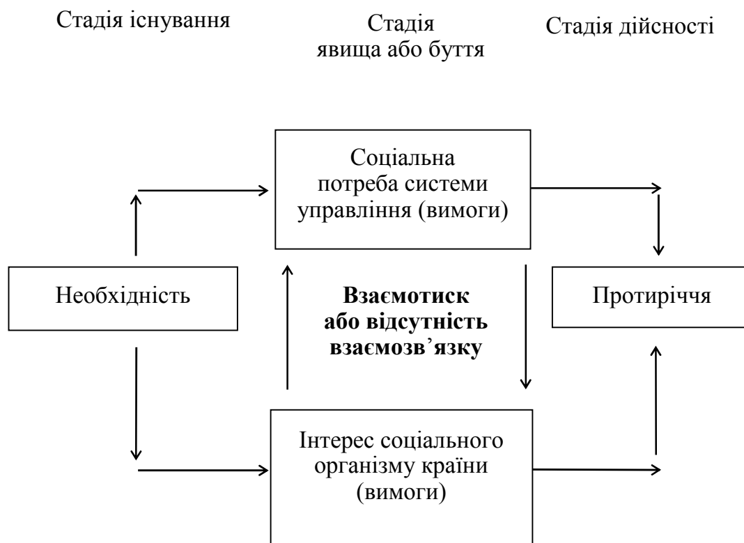
Рис. 1.2.1. Структура поняття “соціальна проблема системи управління”

Формування проблеми відбувається, як відомо, трьома етапами. Алгоритм саморозгортання поняття “проблема”, як рух сутності цілого, проаналізовано у гегелівському вченні про науку логіки [112].