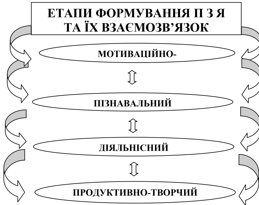
Рис. 2. Взаємозв'язок етапів формування професійно значущих якостей студентів економічної галузі

Загальновідомо, що вміння та навички формуються на основі теоретичних знань. В цьому контексті важливого значення набуває діяльність на другому етапі формування професійно значущих якостей, коли студенти мають змогу збагачуватися комплексом необхідних фахових знань та постійно поповнювати їх на лекційних заняттях, під час консультацій, у процесі самостійної роботи і т. д.