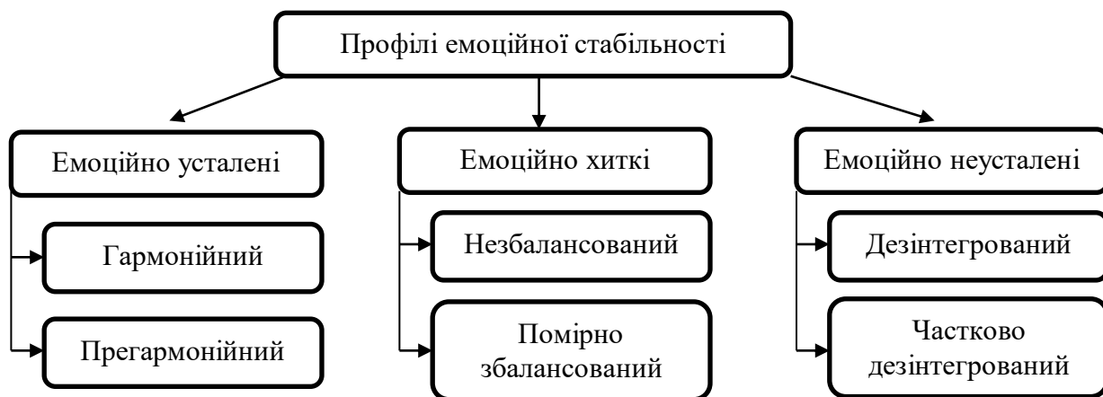
Рис. 1.1 Профілі емоційної стабільності корекційних педагогів

На основі наукових досліджень К. Пилипенко нами було проаналізовано особистісну типологію профілів емоційної стійкості фахівців спеціальної освіти за їх якісними відмінностями психологічних показників. Профілі емоційної стабільності корекційних педагогів представлено на рисунку 1.1.