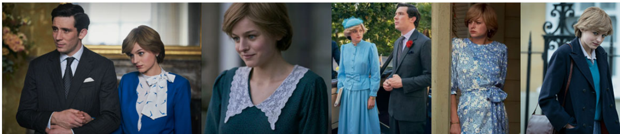
Рис. 5. Принцеса Діана в одязі синього кольору

Синій колір мав особливе значення для романтичного руху, він був кольором кохання, меланхолії та мрій (Pastoureaux, 2001, р. 139). Блакитна квітка (нім. blaue blume) була центральним символом натхнення для німецького романтизму. Її ввів німецький письменник Новаліс у своїй незакінченій історії дорослішання під назвою «Генріх фон Офтердінген» (Pastoureaux, 2001, р. 139). В англо-американській традиції слово «blue» (у перекладі синій), яке багато мов прийняли без змін, використовується як термін для меланхолії, ностальгії та депресивних настроїв (Pastoureaux, 2001, р. 140). Так само образ принцеси Діани є провідником романтичних настроїв у серіалі.