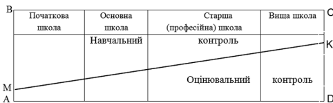
Рис. 1. Співвідношення між оцінювальним і навчальним контролем на різних етапах освітнього процесу

На рисунку добре прослідковується педагогічна закономірність: з переходом від одного ступеня навчання до іншого зростає значення оцінювального контролю, який домінує у вищій школі, де готують фахівців відповідно до освітньо-кваліфікаційних характеристик. Тому вища школа повинна організувати засвоєння студентом необхідної кількості знань з наступною перевіркою стану їх вивчення й відповідним оцінюванням.