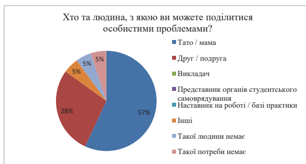
Рис. 1. Психосоціальна підтримка здобувачів

Незважаючи на те, що це студенти закладу вищої освіти, і третина з них паралельно з навчанням працює, виявилось, що вони залишаються дуже залежними від своїх батьків: 71% респондентів повідомили, що довіряють лише батькам, і 56,9% – діляться особистими проблемами лише з батьками; ідесь близько третини ділиться з друзями (рис. 1).