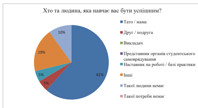
Рис. 2. Взірець для наслідування у здобувачів

Також батьки продовжують залишатися для більшості здобувачів взірцем для наслідування (66,1%) та прикладом успішності (61%). Лише 10% респондентів відзначили, що більше цінують знання та вміння, які їм передають викладачі та наставники (колеги) на роботі, але жоден не вказав, що хоче бути успішним, як його викладач, чи ті студенти, які входять до органів місцевого самоврядування (рис. 2). Варто зауважити, що 12 чоловік з опитаних таку потребу має.