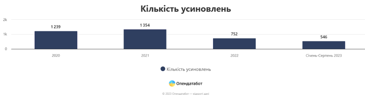
Рис.3. Кількість усиновлень у 2020-2023рр.

Коли батьки не можуть мати дитину можна усиновити дитину або взяти під опіку. За даними Нацсоцслужби, за 2022 рік в Україні було взято під опіку 6,5 тис. дітей, а за I квартал 2023-го — 1,7 тис. дітей. Кількість усиновлень навпаки зменшилась (рис.3).