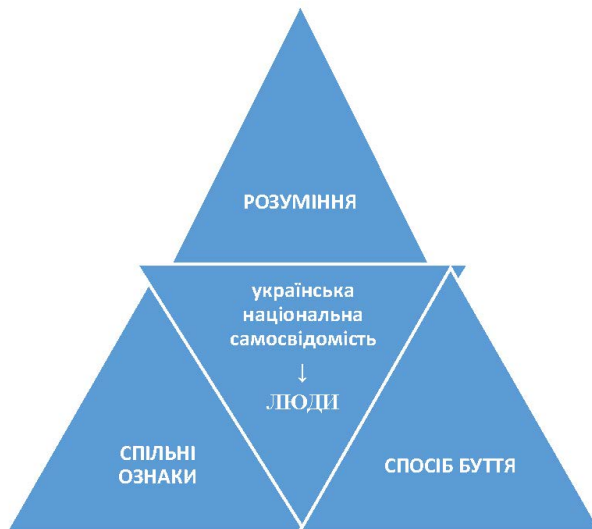
Рис. 1. Лексико-семантичне поле словосполучення українська національна самосвідомість

Рис. 1 ілюструє спільну та диференційні семи лексико-семантичного поля словосполучення українська національна самосвідомість :