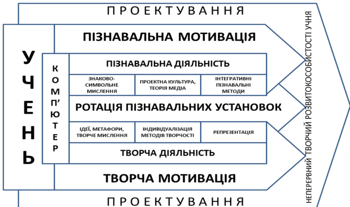
Рис.1. Модель творчого розвитку особистості учнів на основі інтеграції комп'ютерних технологій у художню освіту.

Аналіз проблем використання комп'ютерів, внутрішніх мотивів і вікових особливостей сучасного підліткового середовища, дозволив нам сформулювати свою позицію і розробити відповідну модель (рис. 1). В основі моделі знаходиться ставлення до творчості не стільки як до спонтанного сплеску натхнення і почуттів, а як до багатоступінчатого структурно-вибудованого процесу. Такий підхід однозначно орієнтований на найактивніший і широкий процес знаково-символічної діяльності. Причому, цей процес взаємообомовлений – він вимагає освоєння і включення будь-яких означених елементів у творчий процес, неминучо породжуючи нові смисли та їх носіїв – нові знаки і символи, створювані мисленням підлітка.