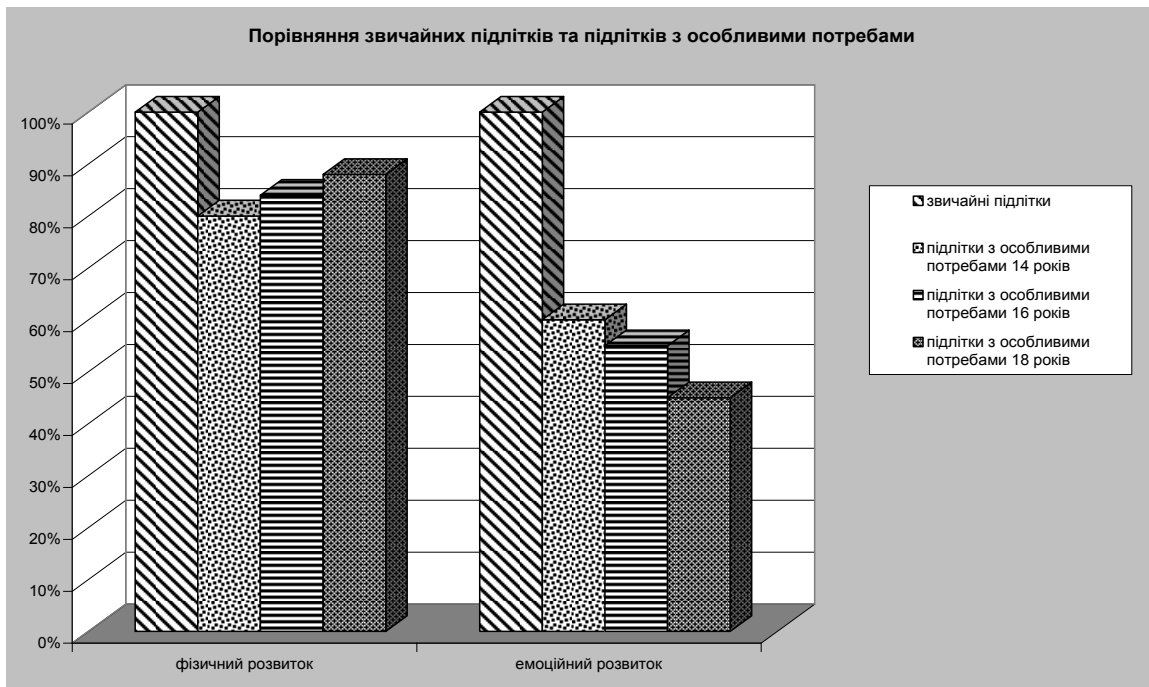
Рис.1 Сравнение развития подростков (собственная разработка на основе экспериментальных наблюдений).

В результате проведенного исследования установлено динамику особенностей поведения лиц подросткового возраста, что показано на рис.2. Проведенные наблюдения показывают устойчивую динамику падения основных показателей для подростков 14-18 лет во всех сферах компетенций, которые исследовались по методике ААРЕР. Для этих подростков характерными есть: страх, связанный со школой, трудности в учебе; страх, связанный с определением собственного места в группе сверстников, а также страх, связанный с сексуальными потребностями. Кроме того имеют место осложнения, связанные с питанием: анорексия, булимия; разнообразные зависимости. Следует отметить также деструктивное поведение: агрессия, преступность и попытки самоубийства; психические отклонения, в частности депрессия.