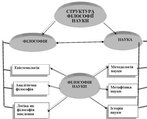
Схема 1. Структура філософії науки (складено автором тез)

Філософія науки включає ряд ключових елементів в структурі філософії, які спрямовані на розуміння сутності природи наукового пізнання та його важливої ролі в сучасному науковому дискурсі. Ось основні складові структури філософії науки як міждисциплінарного дослідження, що сприяють формуванню філософсько-аналітичного мислення: 1) епістемологія або гносеологія або теорія пізнання; 2) методологія науки; 3) аналітична філософія; 4) логіка як філософія мислення; 5) метафізика науки; 6) історія науки та ін. (Див. схему № 1).