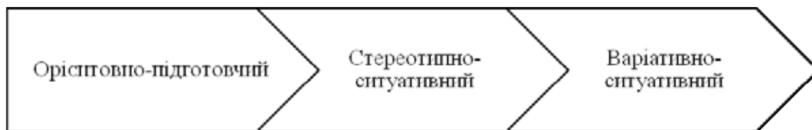
Рис. 2. Рівні формування мовно-комунікативної компетентності майбутніх учителів початкових класів

Ці рівні набуття компетентності є важливим орієнтиром для майбутніх учителів початкової школи на шляху від базових знань до просунутої комунікативної майстерності. Усвідомлення цих етапів розвитку дає змогу укладачам освітніх програм ефективніше підтримувати вчителів у вдосконаленні їхньої мовно-комунікативної компетентності.