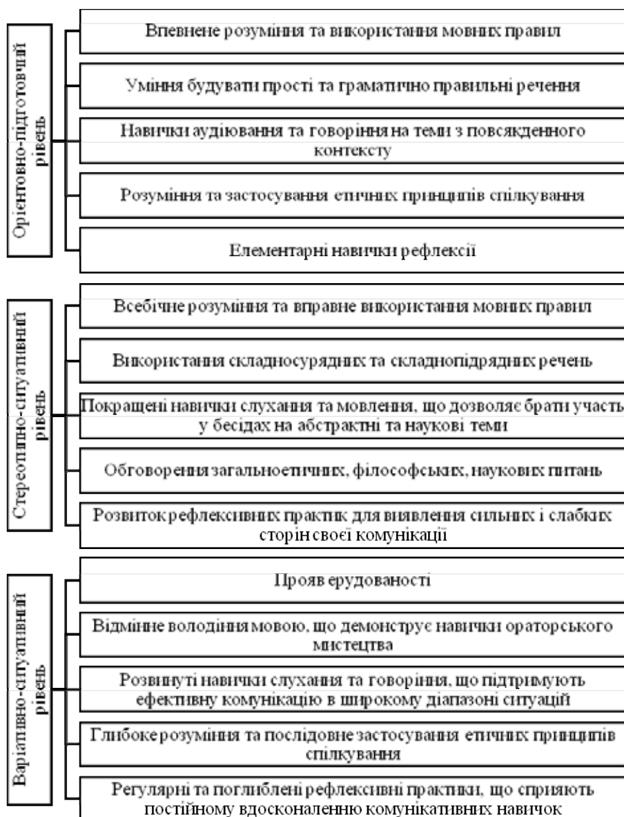
Рис. 3. Критерії та показники формування мовно-комунікативної компетентності майбутніх учителів початкових класів на різних рівнях

Висновки. Отже, мовна і комунікативна компетентність учителів відіграє важливу роль у навчанні учнів. Оцінка цієї компетентності за допомогою критеріїв та показників дає змогу переконатися, що майбутні вчителі володіють необхідними навичками та знаннями, які сприятимуть ефективному навчанню та створенню позитивного навчального середовища.