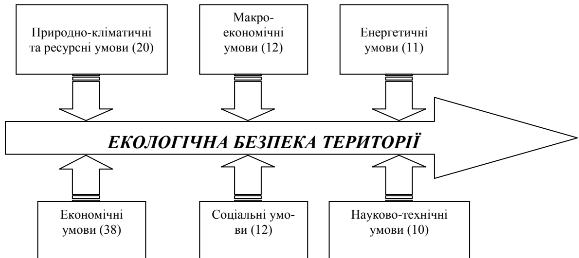
Рис. 1. Структура і взаємозв'язок інформативних чинників впливу на екологічну безпеку території.

1 - У дужках наведено кількість інформативних чинників згідно наявної статистичної звітності.