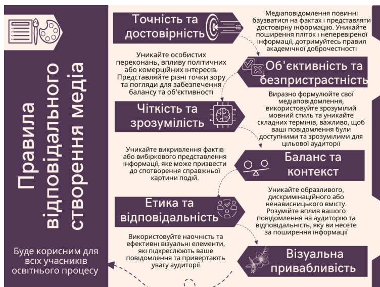
Рис. 3. Правила відповідального створення медіа

Формування медіакомпетентності в закладах вищої освіти включає ряд методів та підходів, які сприяють розвитку навичок і розумінню медіа в контексті сучасного світу. Вважаємо, що основні методи формування медіакомпетентності включають наступні (табл. 1).