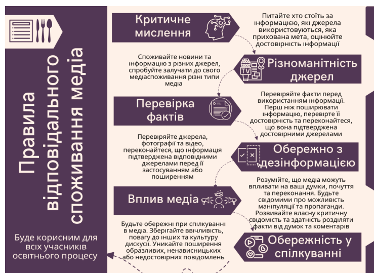
Рис. 2. Правила відповідального споживання медіа

Узагальнюючи рекомендації щодо відповідального споживання та створення медіаконтенту з урахуванням правил медіагієни, пропонуємо наступні чек листи у вигляді інфографіки (рис. 2, 3).