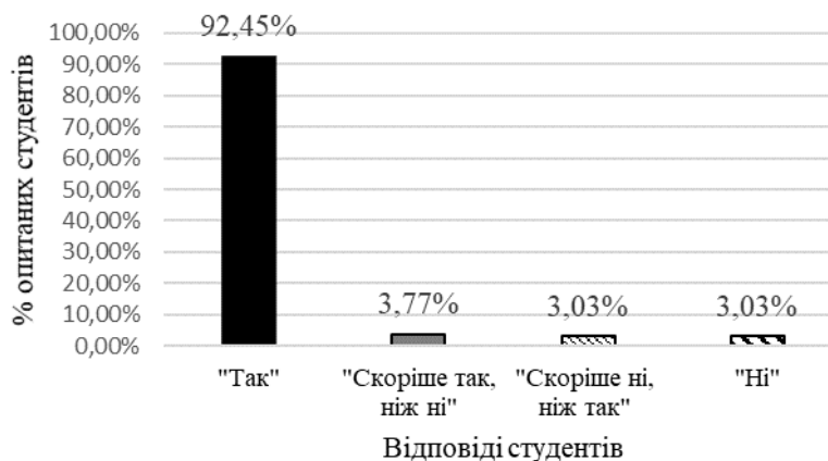
Рис.3. Суб'єктивне сприйняття студентами важливості формування softskills для ефективно розв'язувати складних спеціалізованих завдань і практичних проблем у роботі за фахом

Рис.2. Суб'єктивне сприйняття студентами важливості різних видів практикумів для подальшої професійної діяльності Відповіді на наступне запитання анкети: «Чи потрібно майбутньому вчителю Нової української формувати softskills для ефективно розв'язувати складних спеціалізованих завдань і практичних проблем у роботі за фахом?» – відобразили майже повну однотайність студентів щодо цієї проблеми – 92,54% опитаних вважають це необхідним. Студенти пояснюють це тим, що практика дає можливість формувати softskills, що дозволить їм мати повне уявлення про те, які навички будуть затребувані у XXI столітті. Здобувачі освіти виділяють: аналітичне мислення і інноваційність; активне навчання і стратегії навчання; комплексне розв'язання проблем; креативність, оригінальність і ініціативність; життєздатність, стресостійкість і гнучкість; формування нових ідей, для того, щоб вигідно презентувати себе та витримувати конкуренцію з іншими кандидатами на робочі місце в умовах глобалізації. Водночас 3,77 % серед тих, не дали виразно позитивної відповіді на це запитання анкети. Цей показник ілюструє рис.3.