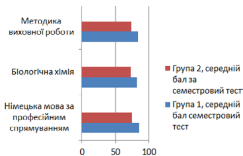
Рис. 2. Проведення контрольного семестрового тестування в обох групах кожної дисципліни

За результатами дослідження (рис. 2) відомо, що здобувачі освіти (група 1) мали вищий рівень активності та кращу успішність, ніж при проведенні занять лекційним методом (група 2) з використанням презентацій в Power Point. Крім того, в відкритих відповідях слухачі зазначили, що «відчувають позитивний ефект від занять з використанням проєкту, де інформація про навчальні матеріали є більш доступною, що допомагає їм легше зрозуміти теми»; «Я вважаю, що робота в групах може бути корисною, оскільки ви вислуховуєте ідеї та думки інших людей і, таким чином, отримуєте більш повне уявлення про тему, погляди на тему»; «Я дізнався багато корисної інформації та технік. Я вважаю, що часу на занятті було відведено достатньо, незважаючи на велику кількість інформації, яку ми опрацьовували»; «Я вважаю, що завдання з написанням пропозицій та експертна критика були дуже корисними»; «Вправа на проведення інтерв'ю була дуже корисною».