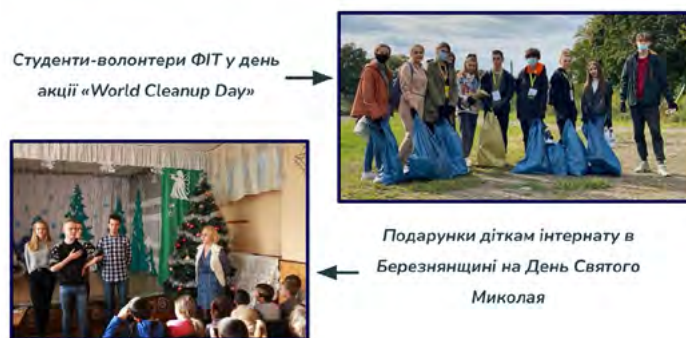
Рис. 7. Застосування технології навчання у співпраці в УжНУ

Технологія навчання у співпраці (співробітництво трактується як ідея спільної розвиваючої діяльності викладача та студента. Суть індивідуального підходу в тому, щоб йти не від навчального предмета, а від людини до предмета, йти від тих можливостей, які має індивід, застосовувати психолого-педагогічні діагностики особистості) (рис. 7).