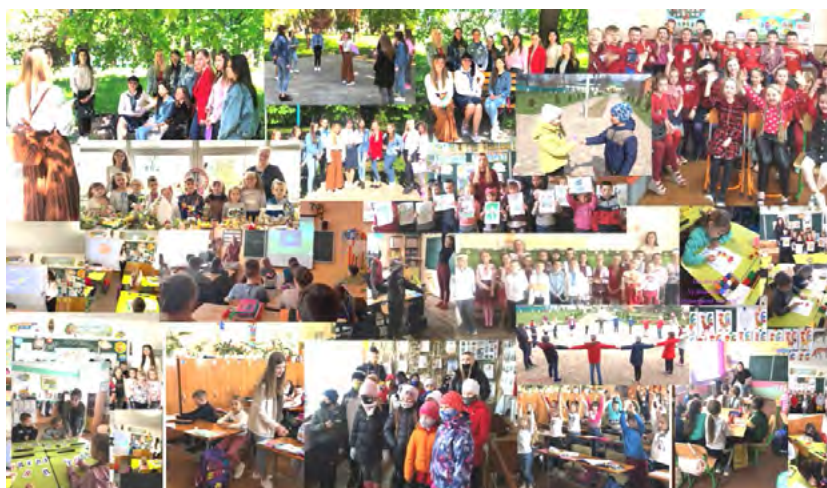
Рис. 6. Застосування створення предметно-розвивального середовища в УжНУ