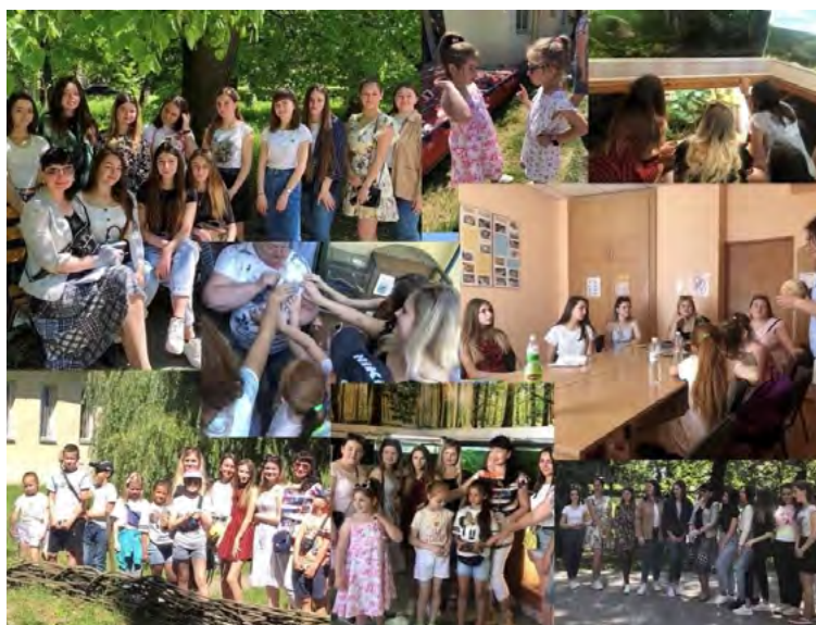
Рис. 2. Застосування технології проєктної діяльності в УжНУ

Технологія проєктної діяльності (під технологією проєктної діяльності розуміється сукупність навчально-пізнавальних прийомів, які дозволяють вирішити ту чи іншу проблему в результаті самостійних дій за певним планом для вирішення пошукових, дослідницьких, практичних завдань з обов'язковою презентацією цих результатів). При застосуванні технології проєктної діяльності, беручи участь у розробці та проведенні різних заходів, студенти набувають організаторських умінь: уміння керувати власною діяльністю та діяльністю студентського колективу, вміння планувати свій час, проводити захід за планом, змінювати план заходу у разі непередбачених обставин (рис. 2).