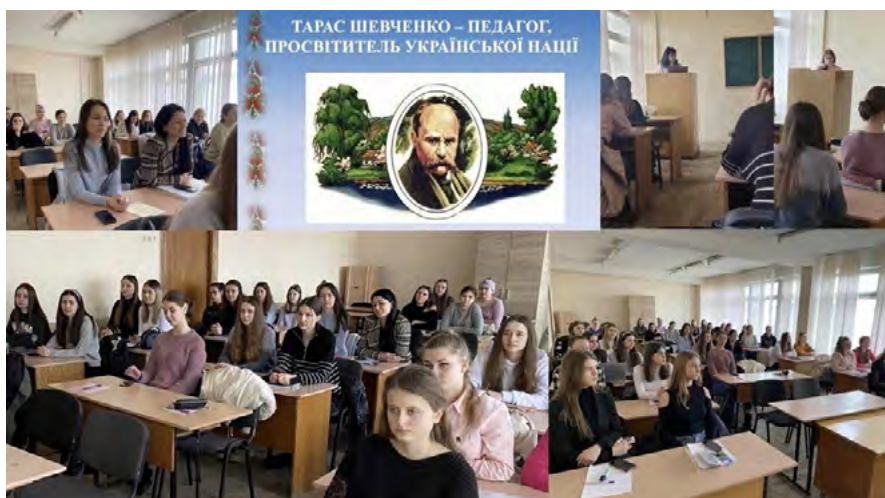
Рис. 3. Застосування технології проблемного навчання в УжНУ

Технологія проблемного навчання (це створення під час навчальної діяльності проблемних ситуацій та організація активної самостійної діяльності студентів з їх вирішення. У результаті відбувається творче оволодіння знаннями, вміннями, навичками, розвиваються розумові здібності). Технологія проблемного навчання в УжНУ активно застосовується у підведенні підсумків діяльності студентських організацій на зборах, звітно-виборних конференціях. Студенти виявляють здатність до професійної рефлексії та самоаналізу, аналітичні та діагностичні вміння, вміння оцінити результати своєї роботи та діяльності колег (рис. 3).