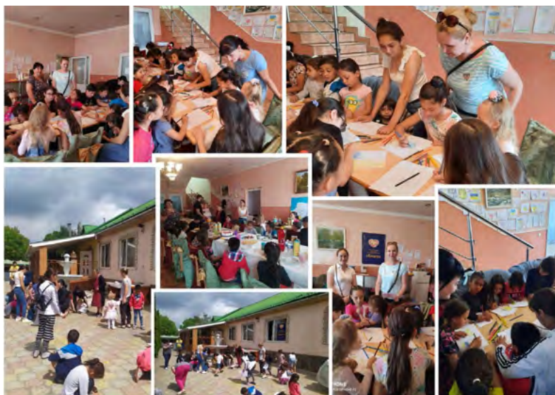
Рис. 5. Застосування кейс-технологій в УжНУ

Кейс-технологія (інтерактивна технологія навчання, спрямована на формування у студентів знань, умінь, особистісних якостей на основі аналізу та вирішення реальної або змодельованої проблемної ситуації в контексті професійної діяльності, представлена у вигляді кейсу) (рис. 5).