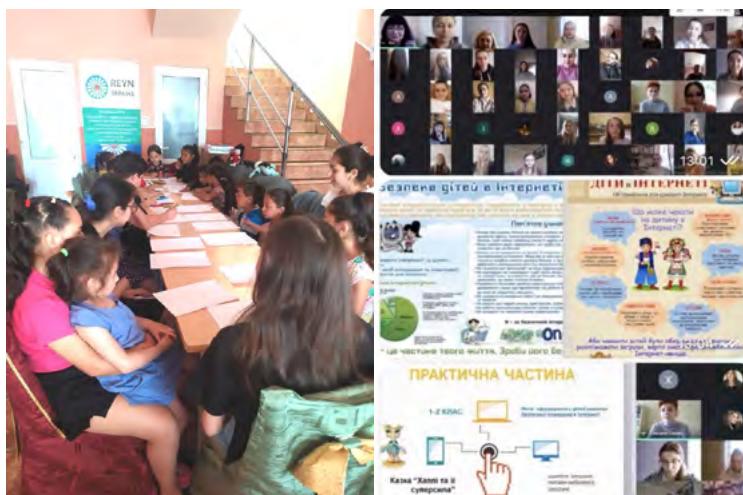
Рис. 4. Застосування ігрових технологій в УжНУ

Кейс-технологія (інтерактивна технологія навчання, спрямована на формування у студентів знань, умінь, особистісних якостей на основі аналізу та вирішення реальної або змодельованої проблемної ситуації в контексті професійної діяльності, представлена у вигляді кейсу) (рис. 5).