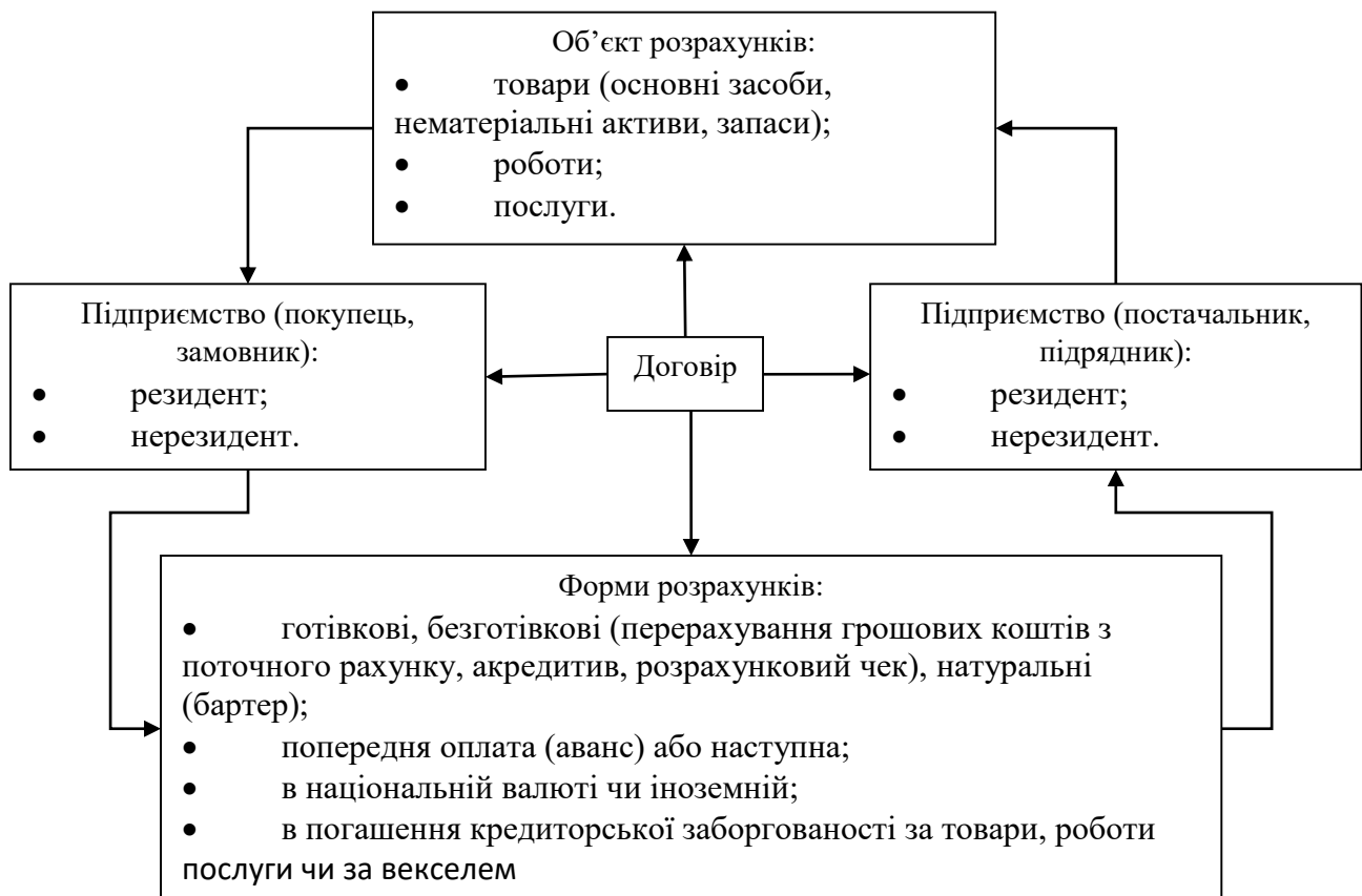
Рис. 1. Складові розрахунків з постачальниками та підрядниками

Схему складових розрахунків з постачальниками та підрядниками і взаємозв’язків між ними відображено на рис. 1.