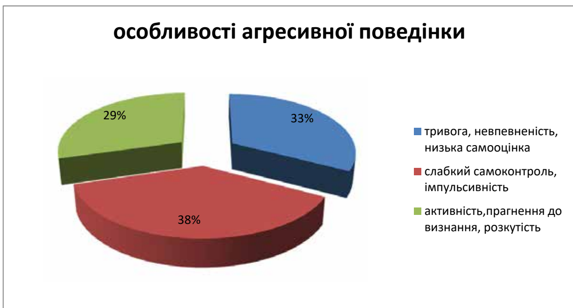
Рис. 2. Кількісні показники вияву особливостей агресивної поведінки