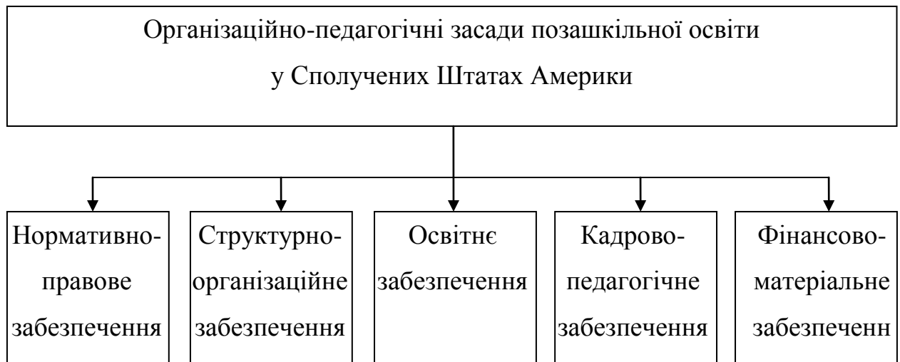
Рис. 2.1. Структура організаційно-педагогічних засад позашкільної освіти у Сполучених Штатах Америки

З'ясовано, що до сучасних організаційно-педагогічних засад позашкільної освіти у США належать такі складові, як: нормативно-правове, структурно-організаційне, освітнє, кадрово-педагогічне, фінансово-матеріальне забезпечення (рис. 2.1).