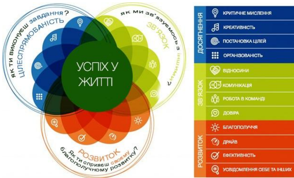
Рис. 2.2. Модель рамоквих навичок «Досягни–Поєднай–Процвітай» («Achieve–Connect–Thrive» (ACT) Skills Framework)

Встановлено, що четвертою складовою забезпечення організаційно-педагогічних засад позашкільної освіти США є кадрово-педагогічне. Саме воно передбачає наявність педагогічних працівників відповідної кваліфікації.