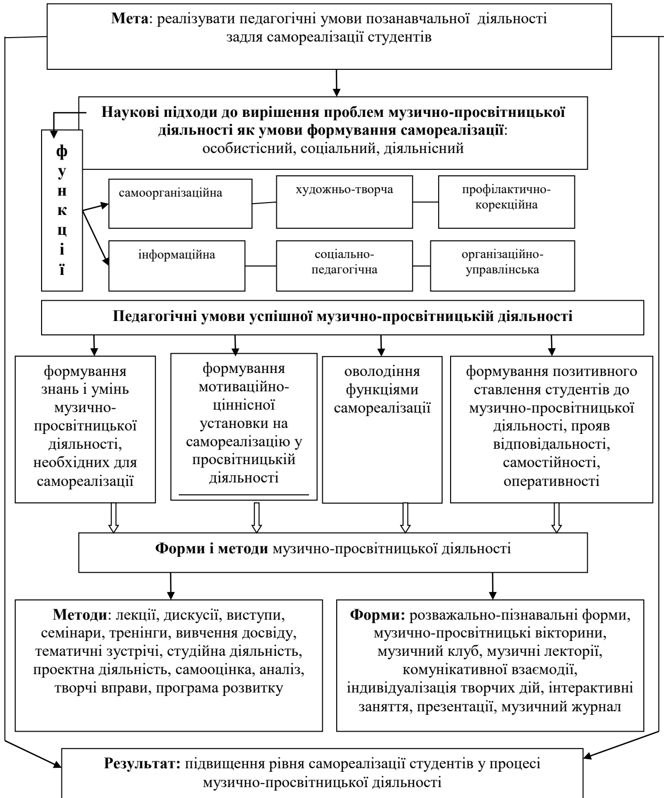
Рисунок 2.2. Структурно-функціональна модель музично-просвітницької діяльності, що впливає на рівні самореалізації студентів