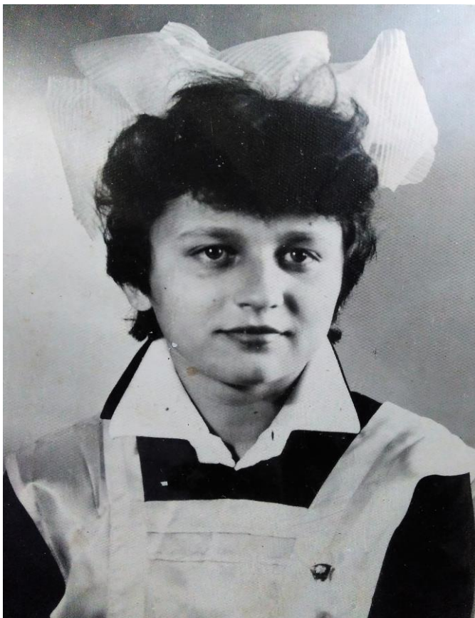
Фото. 6. Випускний клас, 1986 р.