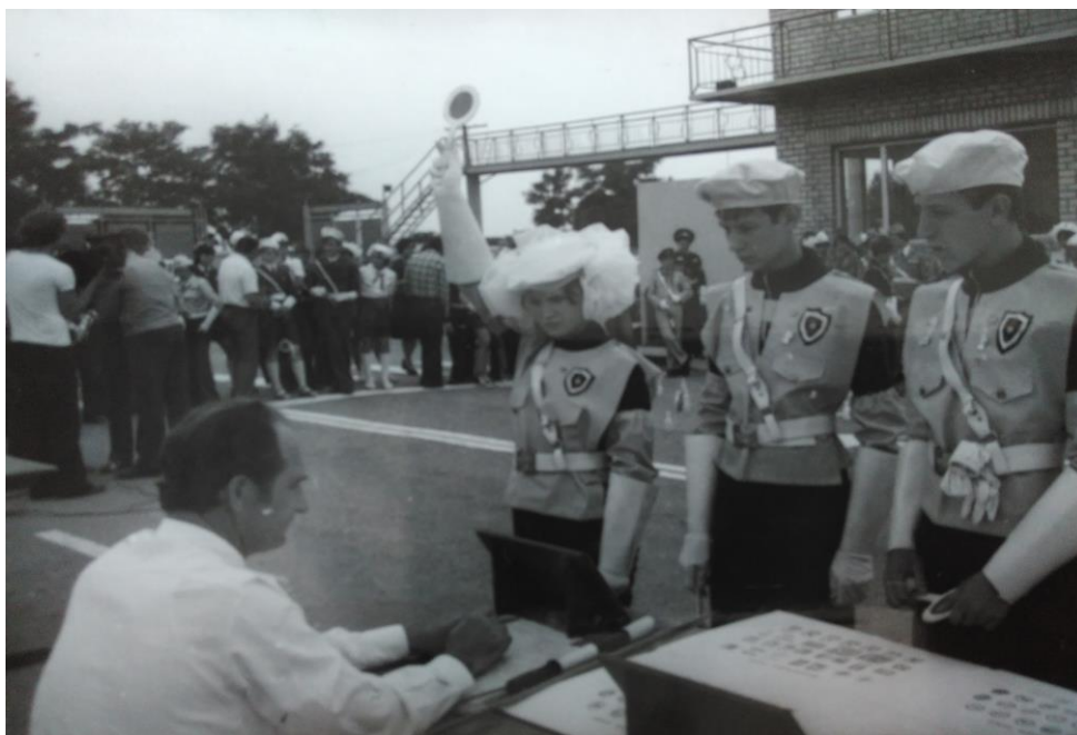
Фото. 11. Військово-спортивна гра «Зірниця»