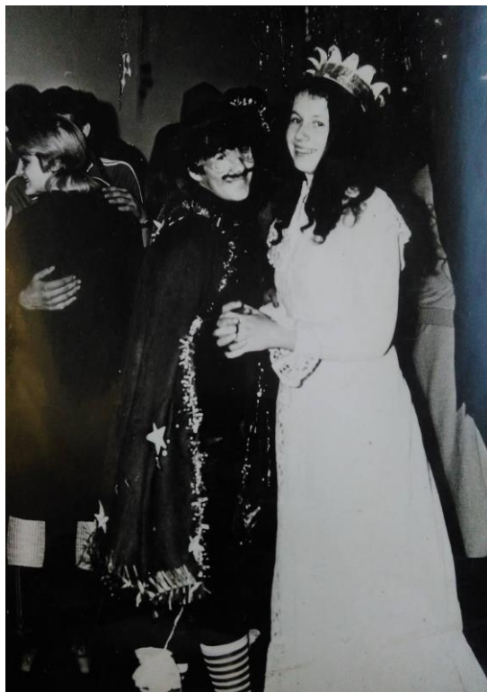
Фото. 7. Новорічний карнавал, 1985 р.