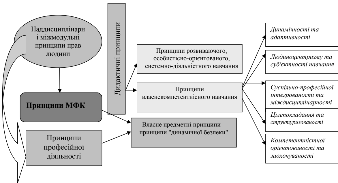
Схема 1. Структурно-логічна схема принципів КОПС ФПК молодших інспекторів ВНІБ у процесі вивчення дисципліни "Спеціальна підготовка" (МФК)

Сукупність принципів КОПС ФПК у процесі вивчення МФК визначено за такою структурно-логічною схемою: