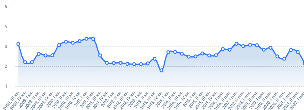
Рис. 1. Динаміка Інвестиційного індексу в Україні [3]

В одному з найважливіших міжнародних рейтингів легкості ведення бізнесу Doing Business у 2020 році Україна посіла 64-е місце і піднялася на сім сходинок порівняно з 2019 роком. Але у 2021 році Світовий банк закритий свій рейтинг Doing Business через ймовірні маніпуляції з даними на користь певних країн, що призвели до викривлення результатів. Тому стратегічні напрямки розвитку бізнес-середовища України пропонуємо аналізувати, спираючись на інші авторитетні дослідження, зокрема, на дослідження Європейської Бізнес Асоціація, яка регулярно проводить опитування, що розкривають різні аспекти актуального стану та розвитку бізнес-середовища в Україні [3]. Зараз Асоціація проводить 12 регулярних досліджень: Індекс інвестиційної привабливості, Митний індекс, Податковий індекс, Судовий індекс, Інфраструктурний індекс, Індекс цифрової трансформації, Міжнародний комплаєнс індекс, Індекс сталого розвитку, Індекс настроїв малого бізнесу, Легкість ведення бізнесу в регіонах, Барометр щастя, Прогнози бізнесу. На основі результатів досліджень формується аргументована картина з найважливіших напрямків розвитку бізнесу. Для прикладу розглянемо деякі показники. Спочатку проаналізуємо динаміку Інвестиційного індексу, що відображає настрої бізнесу щодо поточного стану інвестиційного клімату в Україні та прогнози на найближчі 6 місяців (Рисунок 1).