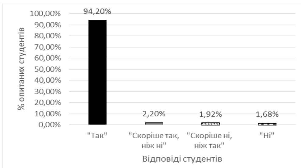
Рис. 2. Суб'єктивне сприйняття студентами важливості формування готовності до іноземної комунікації в роботі за фахом

Що стосується другого питання анкети – «Чи важливим є для Вас формування готовності до іноземної комунікації?», то переважна більшість студентів коледжу вважають, що володіння іноземною мовою є для них важливим (94,2 % опитаних). Окрім цього, 2,2% респондентів, що не дали виразно позитивної відповіді на це запитання анкети, все ж таки відповіли у позитивному аспекті – вони позначили формування готовності до іноземної комунікації скоріше важливим, ніж неважливим. Цей показник ілюструє рис. 2.