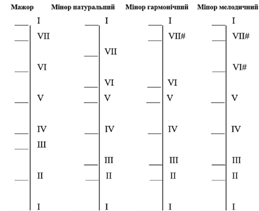
Рис. 3. Графічне зображення мажорної та мінорної гам

У третьому класі відбувалося інтонування вправ у тональності До-мажор у розширеному співацькому діапазоні: ля малої октави – фа (соль) другої октави; розвиток навичок двоголосого співу, а також свідомий спів альтерованих ступенів у До-мажорі з переходом у повну хроматичну гаму [5]. У четвертому класі учні вивчали тональність ля-мінор . “Відкриття тональності” відбувалося після того, коли школярі засвоїли