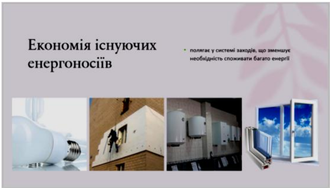
Рис. 2. Знімок екрана під час проведення дистанційного заняття ЛІР 09.04. 2022 р.

Проведення занять ускладнюється і через нестійкий зв'язок в мережах. Зазвичай дві проблеми виникають разом і практично одночасно: втрата електроенергії та швидке погіршення якості зв'язку мобільних та інтернет операторів. Ці проблеми можна частково і короткостроково вирішити за допомогою пристроїв зовнішнього живлення (павербанки) та національного роумінгу від операторів мобільного зв'язку Kyivstar, UA Vodafone, Lifecell. Однак існує чітке розуміння, що якості мобільного інтернет-покриття не завжди достатньо для того, щоб заняття було проведено належним чином. Вимушені перерви у проведенні заняття негативно впливають на можливості учнів опанувати нові знання, що ставить дітей у нерівні умови.