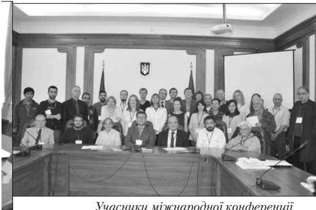
Учасники міжнародної конференції з аналітичної теорії чисел і просторових мозаїк в НПУ імені М. П. Драгоманова

Наш університет з кожним роком усе частіше стає міжнародним творчим майданчиком для обговорення та опрацювання новітніх освітніх методик. Значну увагу університет приділяє залученню до навчального процесу провідних учених світу. Так, у 2019 р. наш університет відвідав Девід Вілкінсон , професор кафедри богослов'я та релігії Даремського університету (Великобританія) з лекцією. Доктор філософії Ягелонського університету Віктор Мозгін під час