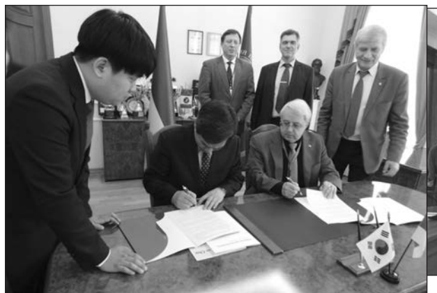
Підписання угоди з Інститутом розвитку інтелекту (Південна Корея)

Але на шляху до більшої мобільності студентів існує ще багато перешкод – від визнання на батьківщині отриманих знань і кваліфікації до фінансової підтримки, плати за навчання і професійних перспектив. Мовний бар'єр і економічні відмінності також упливають на мобільність. Зважаючи на ці причини, більшість студентів усе