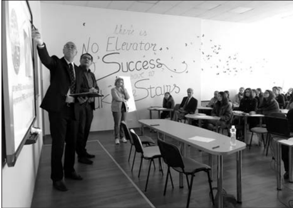
Щороку кожного місяця в університеті відбувається 2–3 міжнародні конференції або семінари

ще не в змозі скористатися можливістю навчання за кордоном, в університеті поширюється практика запрошення провідних закордонних фахівців до України.