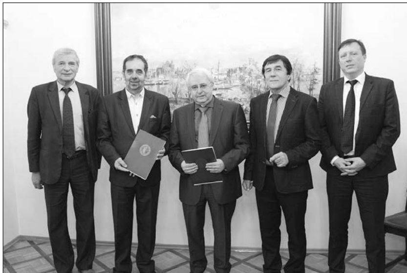
Підписання угоди про співробітництво з Опольським університетом (Польща)

Зокрема, тільки за останні роки підписано угоди про співробітництво з Білефельдським університетом у м. Білефельд (Німеччина), Державним університетом штату Нью Йорк в Онеонті (США), Казахським національним педагогічним університетом імені Абая (Казахстан), Ланьчжоуським Університетом (Китай), Гомельським державним університетом імені Франциска Скоріни (Білорусь), Університетом Малаги (Туреччина), Інститутом розвитку інтелекту (Південна Корея).