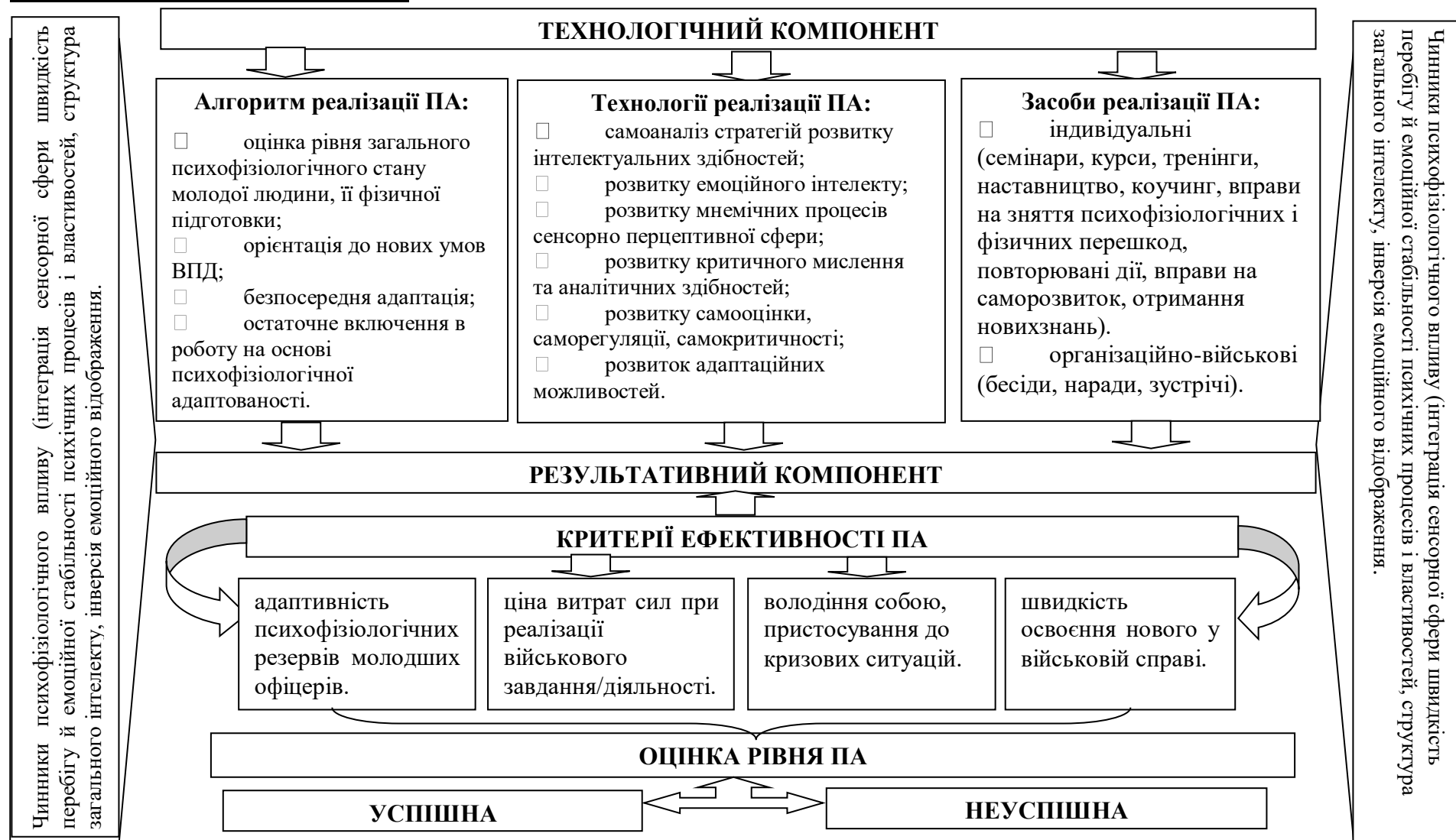
Рис.1. Теоретична модель професійної адаптації молодших офіцерів Збройних Сил України на основі врахування психофізіологічних чинників

Умовні позначення: ПА – професійна адаптація, ВПД – військово-професійна діяльність