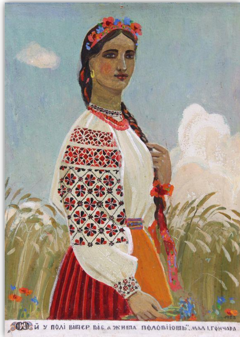
Іван Гончар “Ой у полі вітер віє”, 1983 рік