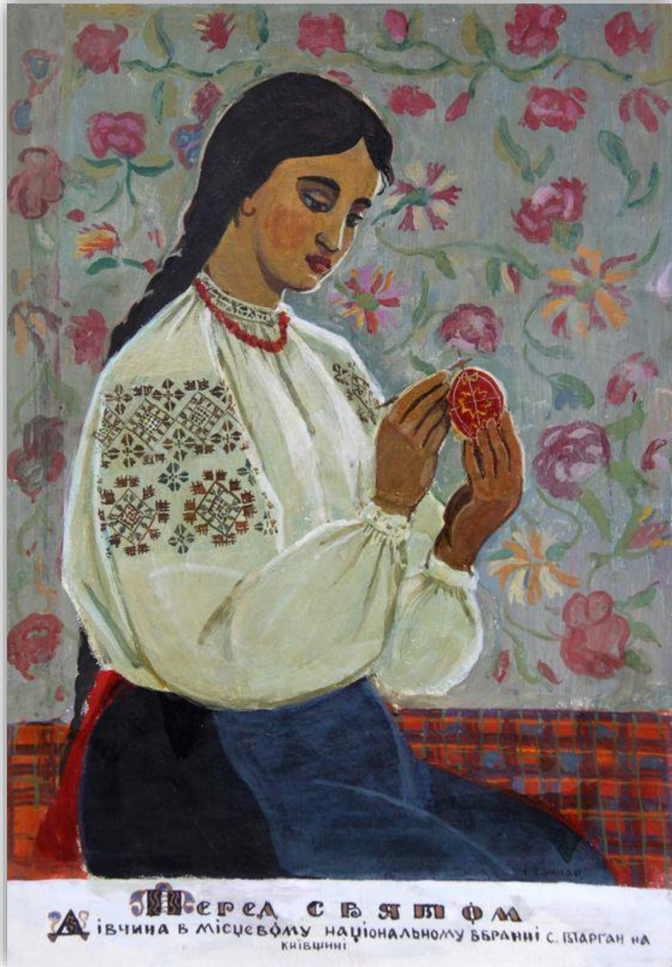
Іван Гончар "Перед святом", 1973 рік