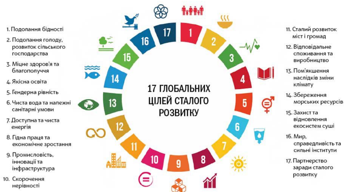
Рис. 3.2. Місце освіти для сталого розвитку (Ціль 4. Якісна освіта) серед Цілей сталого розвитку до 2030 року

Новий Порядок денний сталого розвитку до 2030 року, прийнятий на Генеральній Асамблеї ООН у вересні 2015 року, чітко відображає бачення важливості відповідного навчального реагування. Освітні пріоритети нашого часу прямо сформульовані як окрема ціль: ЦСР 4 (рис. 3.2). «Забезпечити інклюзивну та справедливую якісну освіту та сприяти можливостям навчання протягом усього життя».