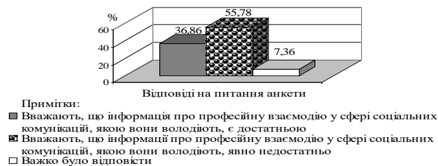
Рис. 2. Узагальнені результати опитування студентів про те, чи є достатньою інформація, якою вони володіють, про професійну взаємодію у сфері соціальних комунікацій, %

В анкетуванні брали участь 214 майбутніх фахівців з документознавства і 9 викладачів таких вищих навчальних закладів, як Луцький інститут розвитку людини Університету «Україна», Національний педагогічний університет імені М.П. Драгоманова, Національний університет водного господарства та природокористування, Східноєвропейський національний університет імені Лесі Українки. Результати анкетування 214 студентів щодо до того, для яких цілей їм потрібна професійна взаємодія у сфері соціальних комунікацій показали, що вважають: для спілкування на професійні теми – 28,03 % студентів, для спілкування на повсякденні теми/поїздки за кордон (подорож) – 23,8 % студентів, планують зв'язати майбутнє з професією фахівця з документознавства – 48,11 % студентів; майбутня спеціальність дасть значні можливості для кар'єрного зростання – 25,58 % студентів, подобається вивчати етичні правила й закони спілкування – 28,53 % студентів; інформація про професійну взаємодію у сфері соціальних комунікацій, якою вони володіють, є достатньою – 36,86 % студентів (рис. 2), інтерес до навчальних дисциплін, пов'язаних з вивченням професійної етики – 42,14 % студентів, відчувають труднощі в оволодінні особливостей професійної етики – 50,56 % студентів.