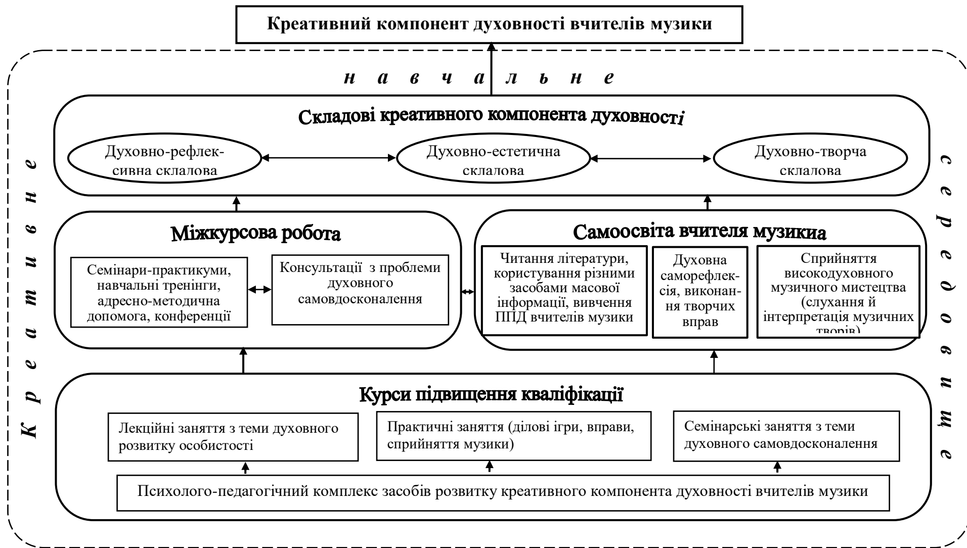
Рис. 1. Психолого-педагогічна програма розвитку креативного компонента духовності вчителів музики в системі післядипломної освіти