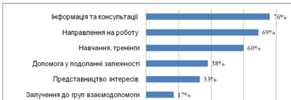
Рис. 2. Розподіл позитивних відповідей на питання "Яку допомогу Вам надавали ці організації?", % (N=42)

Найчастіше суб'єкти пробації отримували такі послуги, як: інформація та консультації (юриста, психолога, лікаря тощо – їх отримали 76 % опитаних); направлення на роботу або допомога у веденні власного бізнесу (69 %) і навчання та тренінги (62 %). Такі послуги, як допомога у подоланні залежності, відновленні контролю над власною поведінкою, представництво інтересів або посередництво та залучення до груп взаємодопомоги отримала меншість опитаних; жодна з організацій не надавала притулку або місця тимчасового проживання та грошової або матеріальної (гуманітарної) допомоги (рис. 2). Водночас згідно із даними особових справ навчання, направлення на роботу і послуга посередництва та представництва інтересів були надані всім засудженим, допомогу у подоланні залежності – кожному третьому, а інші види допомоги документально не були підтверджені.